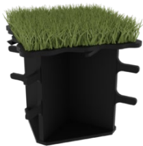
Le Solid 65