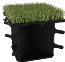
Le Solid 85