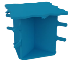
Le Solid Color